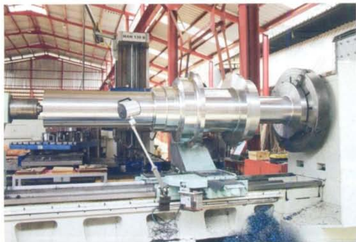
Eixo para Hidrelétrica - Comp. 3000mm - Diam. 800 mm

Com equipamentos nacionais e importados dos Estados Unidos, Europa e Ásia, o Grupo ATA garante precisão na produção de peças e equipamentos nas áreas em que atua e, contando com uma mão-de-obra especializada, é uma referência no mercado de Caldeiraria, Estruturas Metálicas e Usinagem.