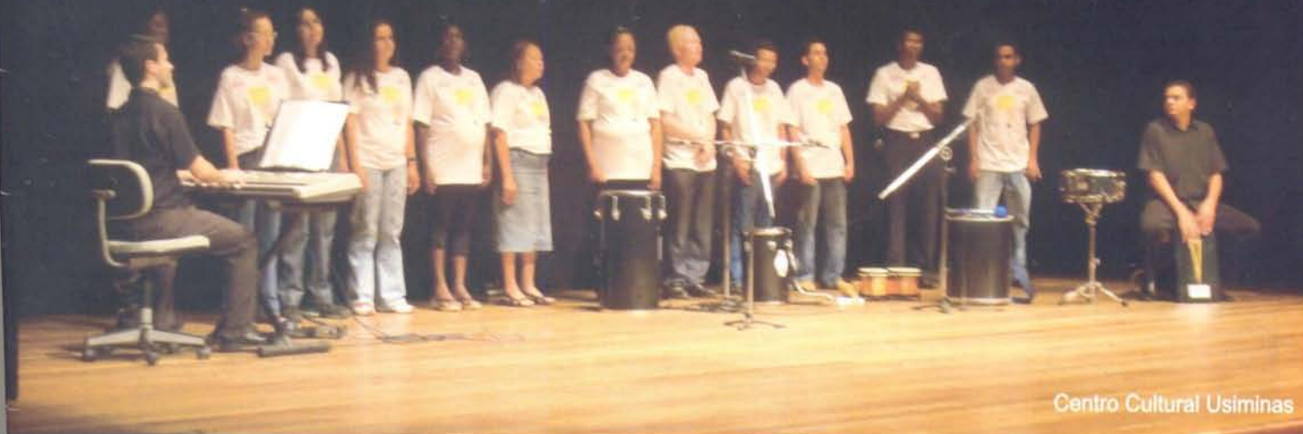
Centro Cultural Usiminas